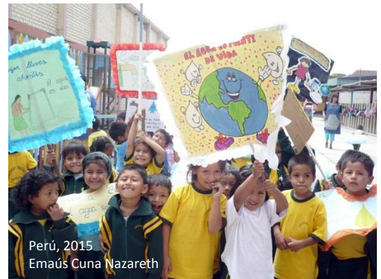
Perú, 2015 Emaús Cuna Nazareth

➔ La solidaridad , que se manifiesta en la comunidad y en la voluntad de convivir. Se trata de una ventaja frente a la soledad o en la resolución de conflictos. Debe vivirse en su dimensión internacional y tener una influencia más allá del movimiento.