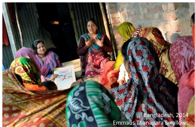
Bangladesh, 2014 Emmaüs Thanapara Swallows