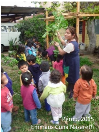
Pérou, 2015 Emmaüs Cuna Nazareth