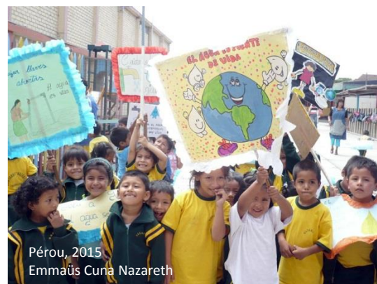
Pérou, 2015 Emmaüs Cuna Nazareth

→ La solidarité , qui s'exprime dans la communauté et la volonté de vivre ensemble, c'est une force face à la solitude ou dans la résolution des conflits. Elle doit se vivre dans sa dimension internationale et rayonner au-delà du mouvement.