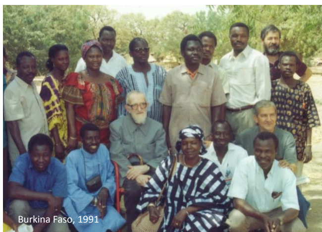
Burkina Faso, 1991