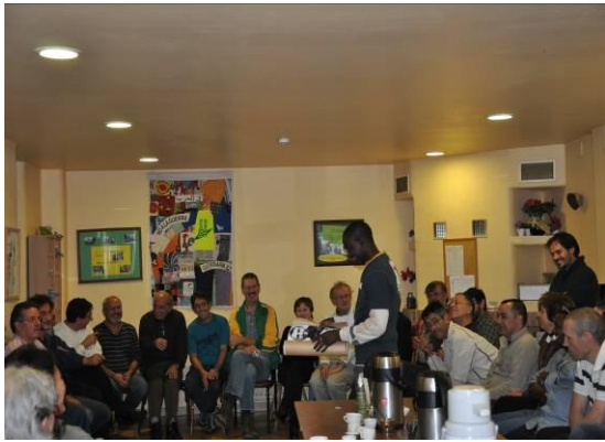
Encuentro con los compañeros de la comunidad de Traperos de Pamplona