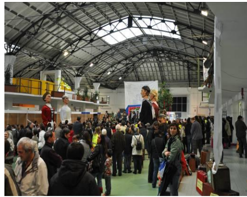
Fiesta de los 40 años de los Traperos en Pamplona

Una parte de esta reunión fue especialmente dedicada al tema de la trata de seres humanos.