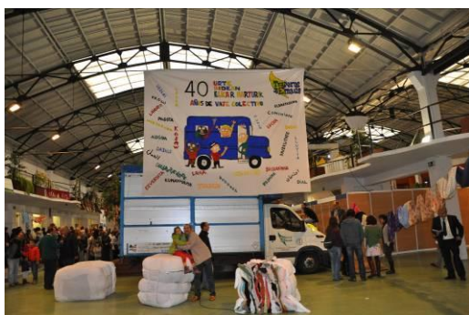
Festividad de los 40 años de los Traperos

Guiados por los principales actores del grupo, los representantes de toda Europa visitaron los sitios que ilustran el gran abanico de sus actividades.