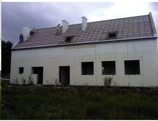
Casa comunitaria en Cracovia.

En este ámbito, la región Europa sirvió de intermediario entre las organizaciones que realizaban las acciones y Emaús Internacional.