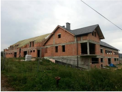
Casa comunitaria en Rzeszow.