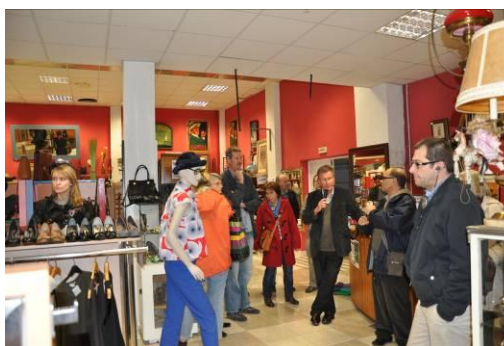
Visita de la tienda situada en la ciudad de Pamplona