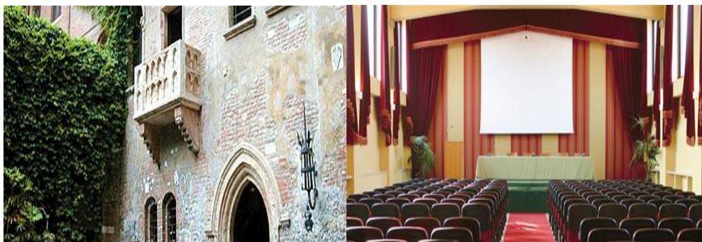
El Centro Carraro en Verona – Italia

“¡Juntos, participemos en una Europa dinámica, deseosa de escucharse, reflexionar y actuar!”