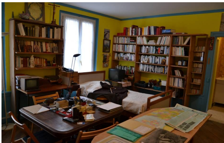
El dormitorio del Abbé Pierre quedó intacto

La celebración del centenario del nacimiento del Abbé Pierre fue el evento mayor. Así, el año empezó con la inauguración del lugar de memoria y vida en Esteville y se acabó con la exposición sobre la vida del Abbé Pierre, hermano de los hombres y provocador de paz , en Roubaix, Francia.