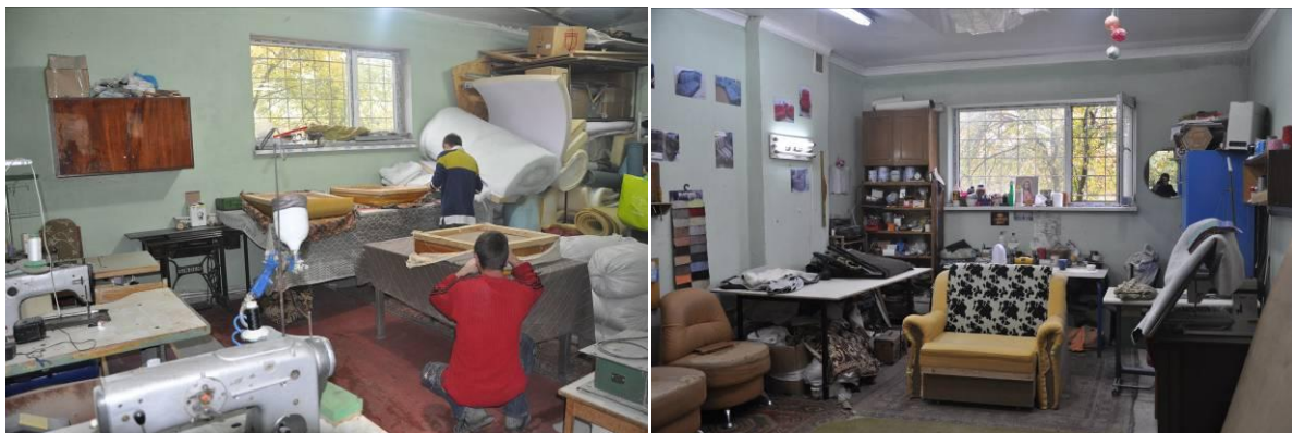
Talleres de reparación de sofás situados en el hotel social de Oselya

Guiados por los compañeros y responsables, los representantes de Emaús de toda Europa visitaron el conjunto de los espacios que conforman el abanico de actividades del grupo.