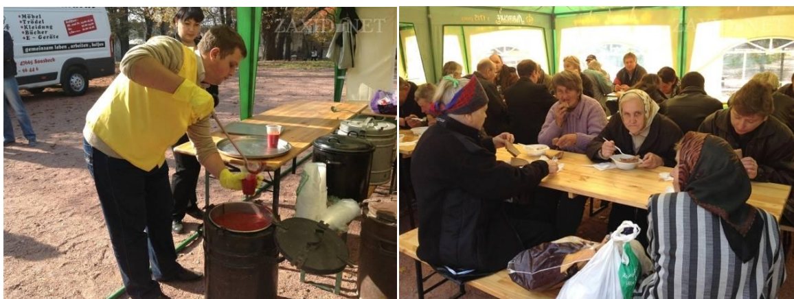
Sopa con las personas sin hogar de la ciudad de Lviv.

El 11 de octubre al mediodía, se compartió una sopa con muchas personas sin hogar de la ciudad. Este almuerzo fue preparado por voluntarios y amigos de Oselya así como por organizaciones socias y el municipio. Más de 100 personas pudieron comer esta sopa con bebidas calientes. ¡Una manera de recobrar fuerzas y animarse antes del duro invierno!