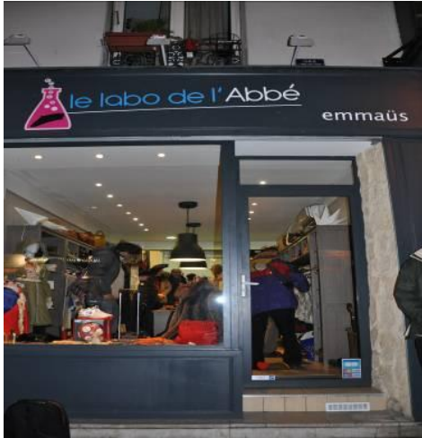
Le Labo de l'Abbé, París, distrito 11.