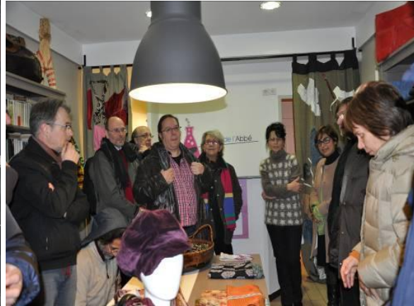
Comercialización y venta de las creaciones de los empleados en inserción.