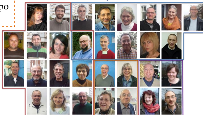
15 Delegados Nacionales (no todos representados)