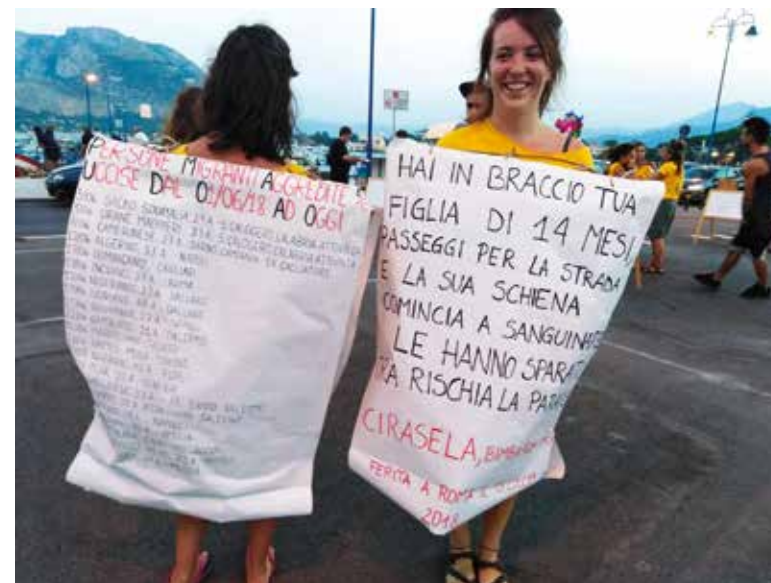
Acción de jóvenes voluntarios de Palermo.