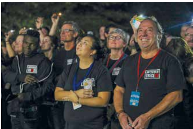
Emaús Europa defiende el artículo 13 de la Declaración Universal de los Derechos Humanos sobre la libertad de circulación. Aquí, una acción en San Sebastián durante la asamblea regional de 2019.