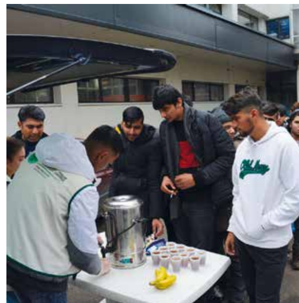
Recepción de migrantes por Emaús en Bosnia-Herzegovina.