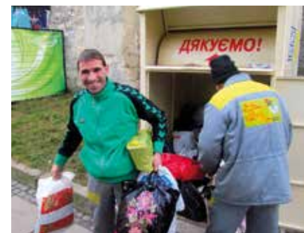
Muchos grupos Emaús están desarrollando contenedores de recogida. Aquí en Oselya, Ucrania.

"¿QUÉ PODEMOS HACER EN EMAÚS EUROPA PARA MEJORAR NUESTRO TRABAJO COLECTIVO, DIFUNDIR NUESTROS VALORES Y CREAR UN VÍNCULO CON LAS NUEVAS GENERACIONES?"