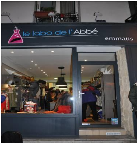
Le Labo de l'Abbé, Paris 11 ème arrondissement