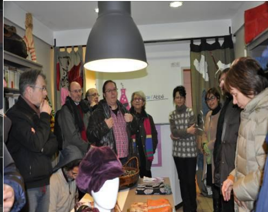
Commercialisation et vente des créations des salariées en insertion