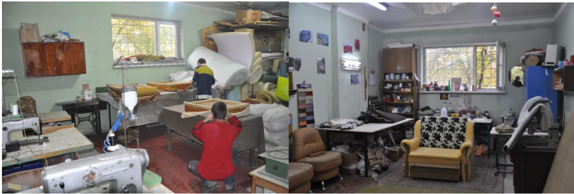
Ateliers de réparation des canapés situés à l'hôtel social détenu par Oselya

Guidés par les compagnons et responsables, les représentants emmaüsien de toute l'Europe ont visité l'ensemble d'espaces illustrant la panoplie des activités du groupe.