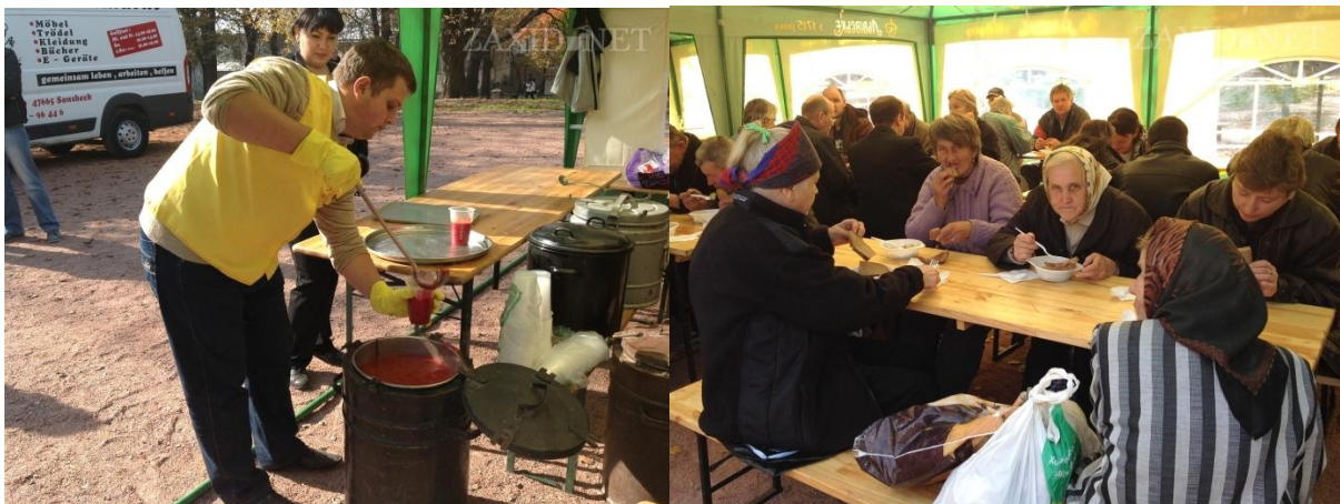
Soupe avec les sans abris de la ville de Lviv

Une soupe a été partagée avec des nombreux sans abris de la ville le 11 octobre à midi. Ce repas a été préparé par des bénévoles et amis d'Oselya ainsi que par des associations partenaires et la municipalité. Plus de 100 personnes ont pris un déjeuner chaud accompagné des boissons chaudes. De quoi requinquer les esprits avant le début du rude hiver!