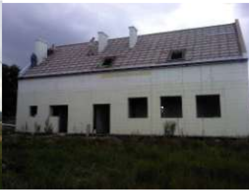
Maison communautaire à Krakow.

Dans ce domaine, la région Europe a été l'interface entre les organisations portant les actions et Emmaüs International.