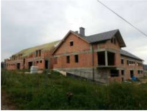
Maison communautaire à Rzeszow.