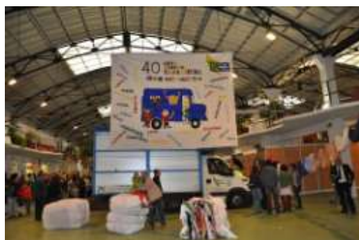
Festivités des 40 ans de Traperos dans la ville

Guidés par les principaux acteurs du groupe, les représentants de toute l'Europe ont visité l'ensemble des sites illustrant la panoplie des activités du groupe.