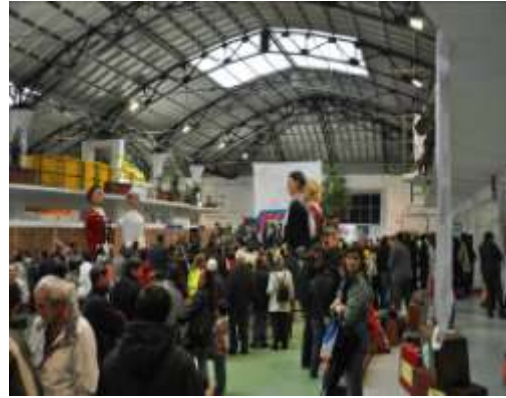
Fête des 40 ans de Traperos dans la ville

Une partie de cette réunion a été spécialement dédiée à la question de la traite des êtres humains. A l'invitation d'Emmaüs Europe ont répondu présent :