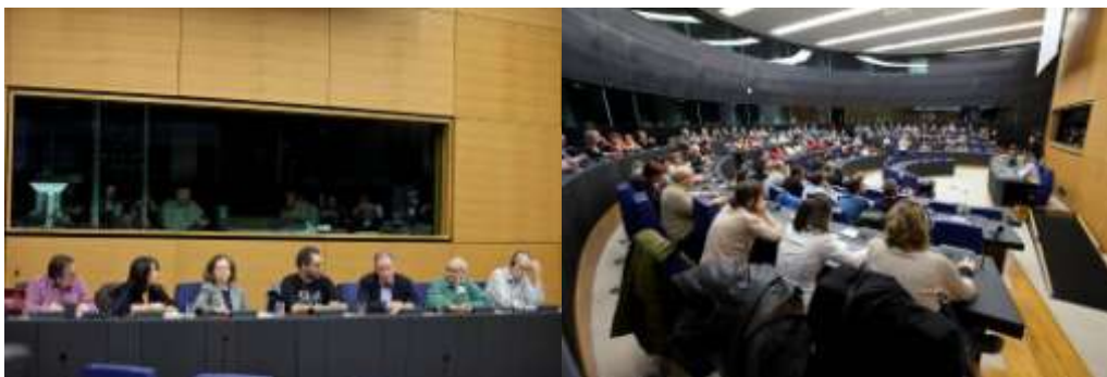
Echange au Parlement européen. Strasbourg. France