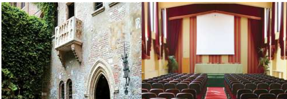
Le Centre Carraro à Vérone – Italie

“ Ensemble, participons à une Europe dynamique, désireuse de s'écouter, de réfléchir et agir ! ”