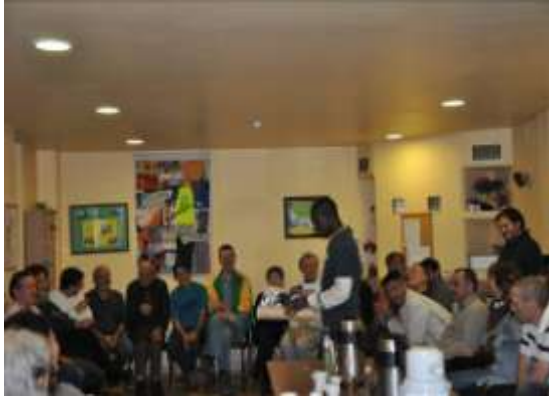
Rencontre avec les compagnons de la communauté de Traperos de Pamplona