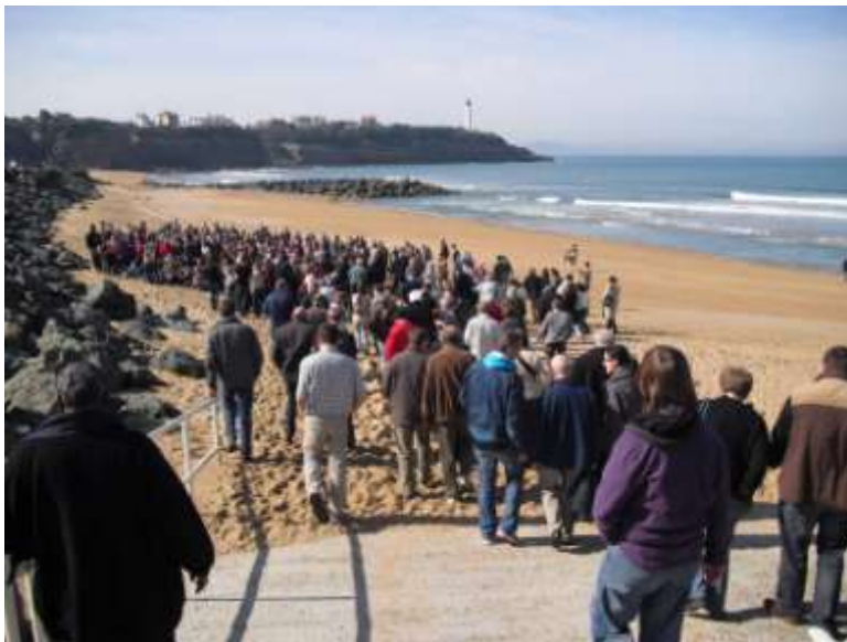
Réunion mondiale des acteurs Emmaüs à Anglet, France.

Nous devons défendre les minorités (Roms, gens du voyage), les migrants, les sans abris, les endettés, et plus généralement, toute personne se trouvant dans la détresse.