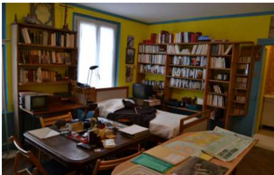
La chambre de l'Abbé Pierre est restée intacte

La célébration du centenaire de la naissance de l'Abbé Pierre en fut l'événement majeur. L'année a ainsi débuté avec l'inauguration du lieu de mémoire et de vie à Esteville et s'est achevée avec l'exposition sur la vie de l'Abbé Pierre, frère des hommes et provocateur de paix , à Roubaix, en France.