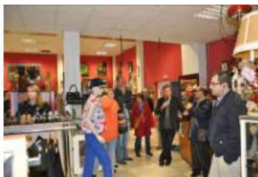
Visite de la boutique située dans la ville de Pamplona