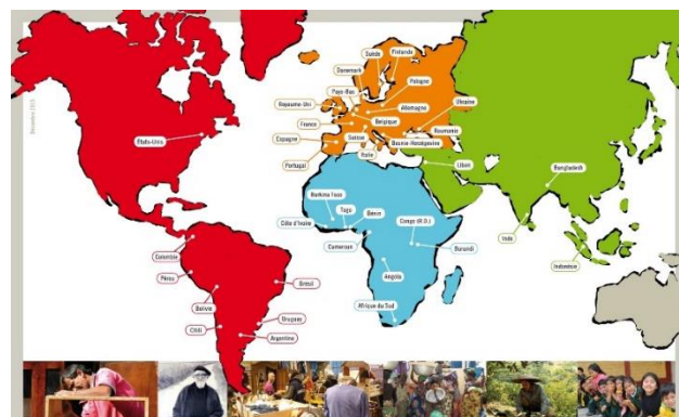
Aujourd'hui, 350 groupes dans 37 pays

Pour pouvoir agir en phase avec nos discours et décisions, nous devons renforcer notre Mouvement. Cela passe par le renforcement de nos moyens collectifs en se responsabilisant, notamment par le paiement d'une cotisation annuelle et du fruit de la vente annuelle de solidarité.