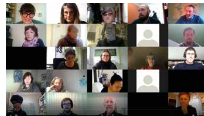
Primer intercambio sobre la sobredosis textil, el 27 de noviembre.

Se preparó un segundo intercambio de prácticas en 2020, que tuvo lugar el 12 de enero de 2021, sobre el lugar de los jóvenes en nuestro movimiento en el futuro; y están previstos varios más a lo largo del año: ¡continuará!