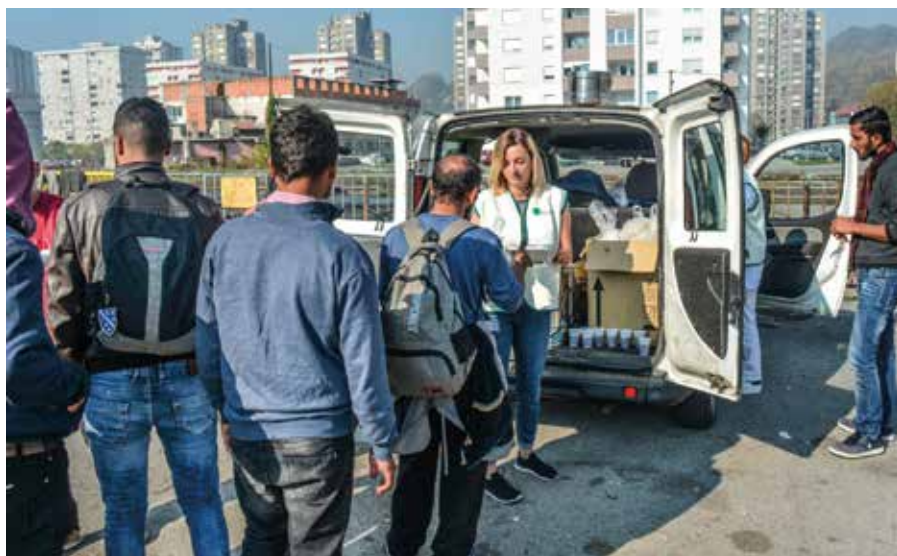
Accueil des demandeurs d'asile par le FIS-Emmaüs sur la route des Balkans.

– «Déclaration conjointe d'Emmaüs international et Emmaüs Europe: Pas de compromis sur le droit d'asile»