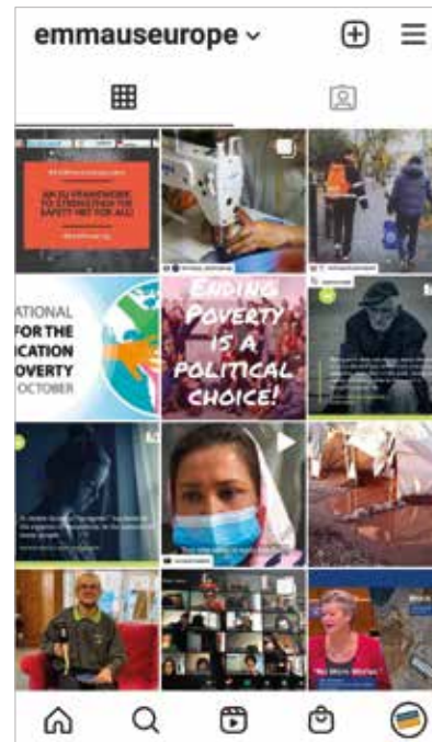
Compte Instagram d'Emmaüs Europe @emmauseurope

Le travail de réflexion a commencé en 2020 et le développement web à la fin de l'année, pour une mise en ligne prévue en 2021.