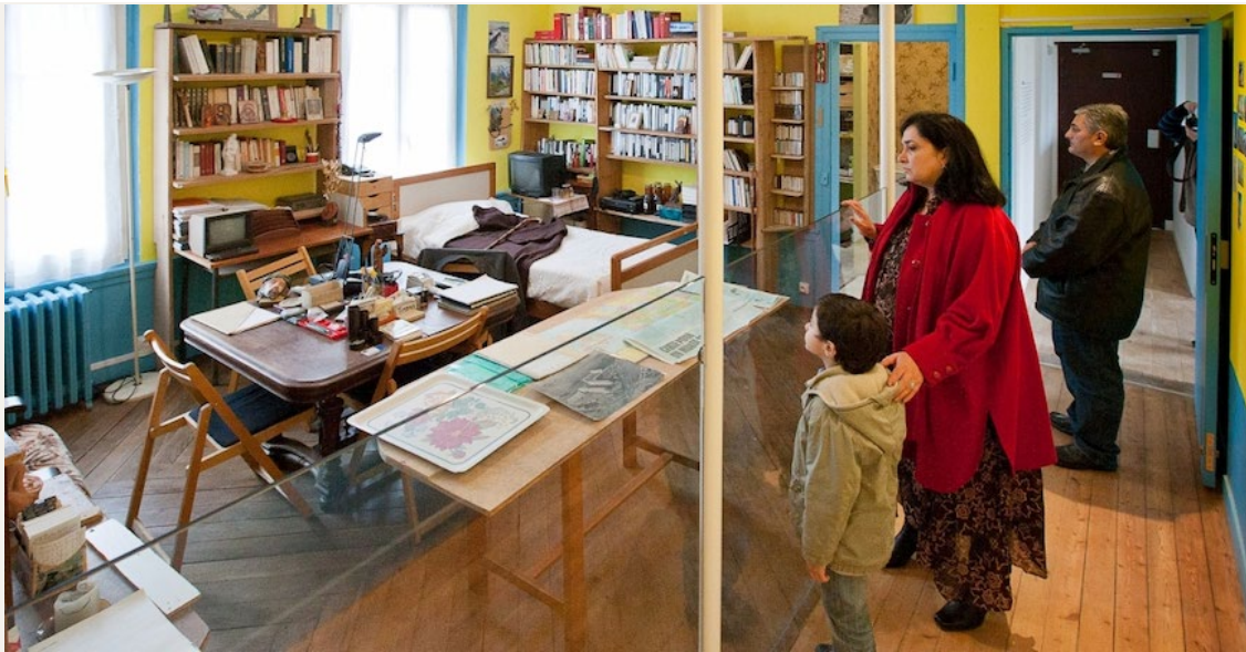
© Centro Abbé Pierre-Emaús, sala del Abbé Pierre

En esta casa de Normandía, Francia, donde el Abbé Pierre vivió sus últimos años, un espacio de museografía ha estado abierto al público desde el 22 de enero de 2012. Las exposiciones se suceden, pero su sala y capilla conservan su estado original.