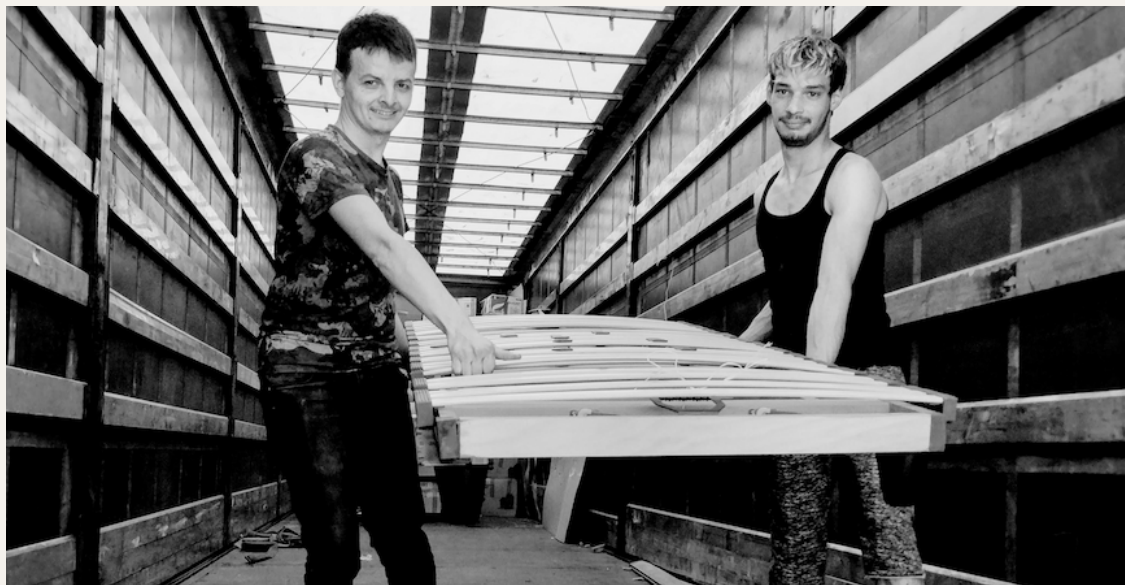
Dos jóvenes de Emaús Satu Mare descargan un transporte solidario de La Chaux de Fonds (Suiza) - mayo de 2022, Rumanía