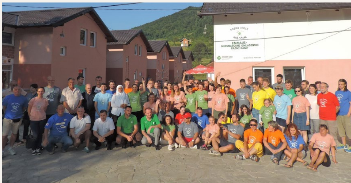
Campamento de verano del FIS-Emaüs en 2019, Srebrenica, Bosnia-Herzegovina

Cada año, varios centros Emaüs de toda Europa acogen a jóvenes -y no tan jóvenes- para que pasen un tiempo con el grupo y se impliquen en un proyecto de solidaridad. Estos campamentos reciben diversas denominaciones, a saber, “campo de verano”, “campo de jóvenes”, etc. pero el resultado es el mismo: una gran experiencia e intercambios fructíferos. Y entonces, ¿cómo se organiza un campo de verano, y cuál es la receta para dar ganas de ayudar a ayudar?