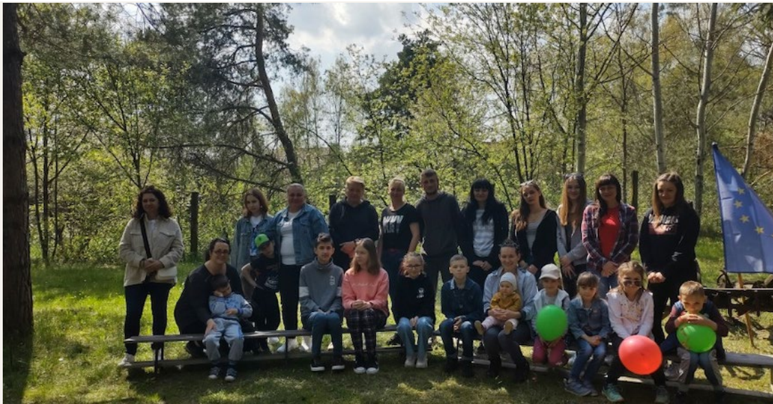
Familias ucranianas acogidas por la Comunidad de Lublin