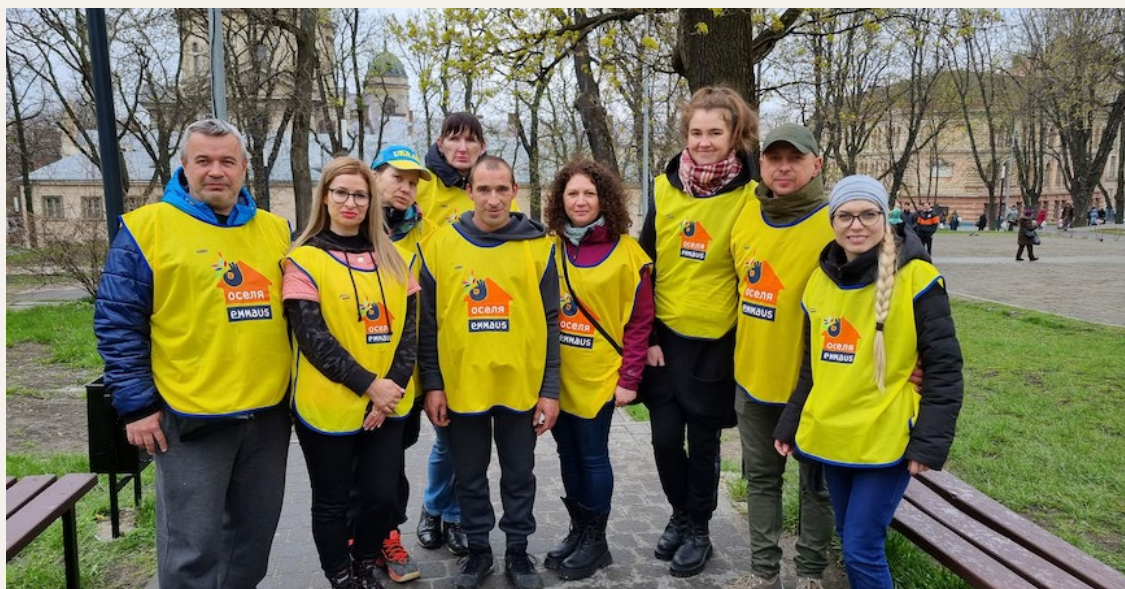
El equipo de Emaüs Oselya durante una distribución de comida en las calles de Lviv, abril de 2022, © Emaüs Oselya.

Ya estamos en septiembre y la guerra lleva más de 6 meses. Pero no hemos olvidado que está en nuestra puerta. Nuestros grupos Emaüs de Ucrania, Polonia y Rumanía, en Europa, están sobre el terreno todos los días para ayudar a las personas refugiadas.