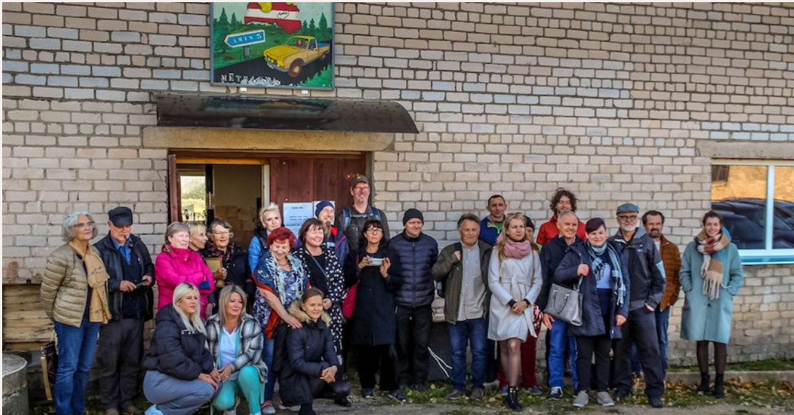
Última reunión del Colectivo Polonia-Ucrania en Letonia

¡Marcad los colectivos en vuestra agenda!