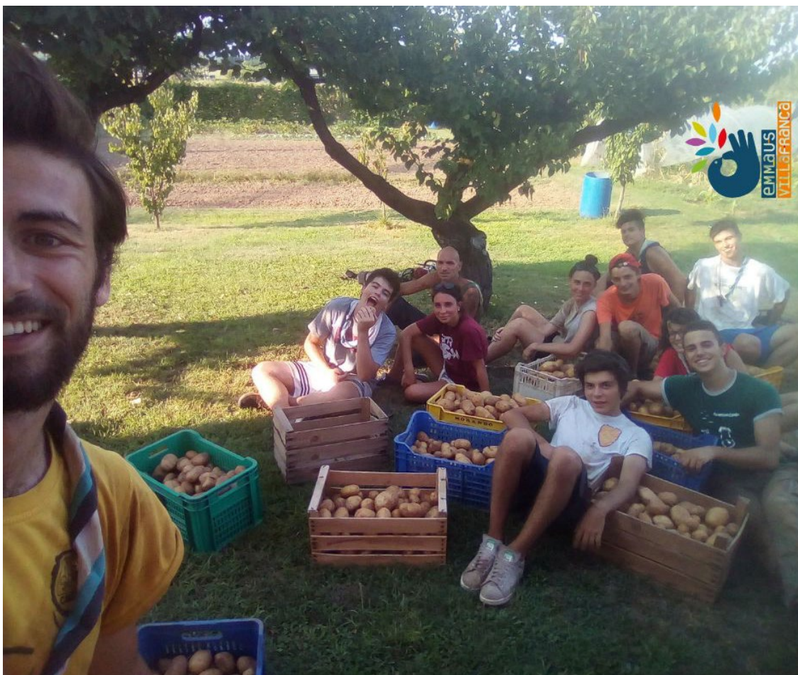
Un vistazo al campamento de verano Emaús Villafranca en 2022 – Realizada por: Emaús Villafranca

Como cada año, numerosos grupos en Europa organizan campamentos de verano para transmitir los valores de Emaús, dar a conocer la vida en el seno del grupo Emaús ¡y animar a la próxima generación a que se una al movimiento!