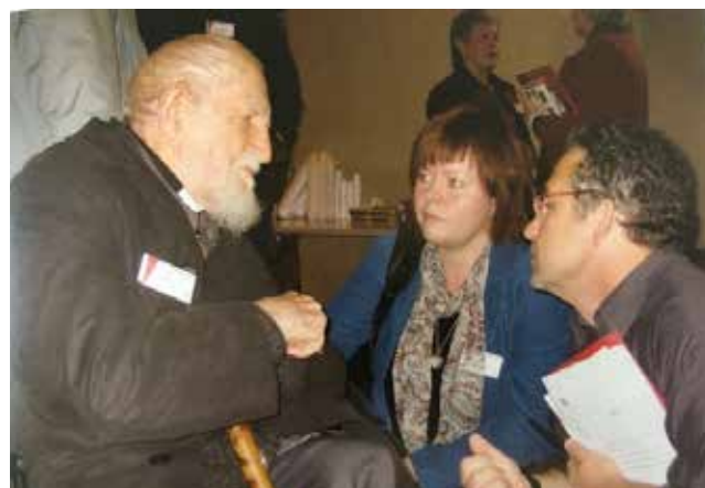
Abbé Pierre, Carina Aaltonen et Alain Fontaine, à la Conférence européenne de Florence - Ensemble contre l'esclavage contemporain, du 19 au 21 octobre 2005.