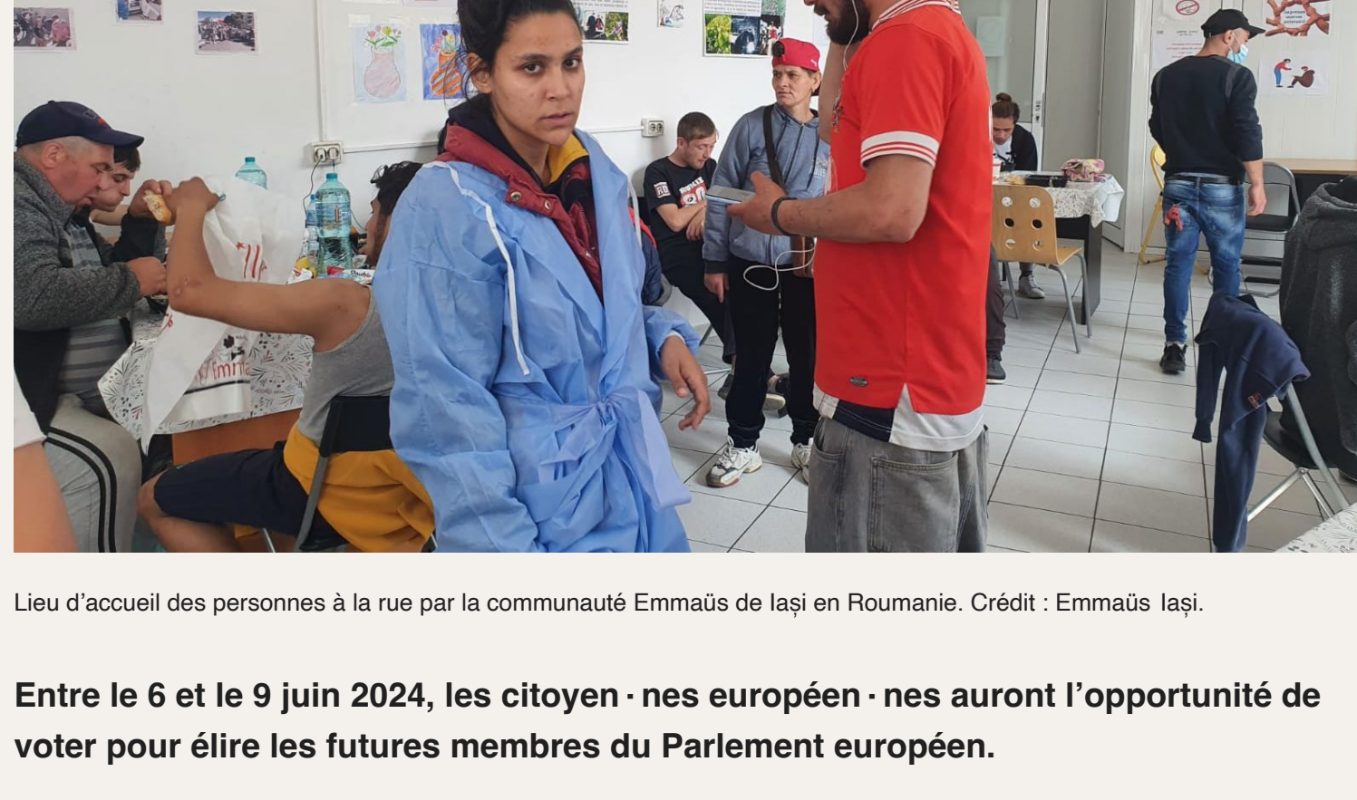
Lieu d'accueil des personnes à la rue par la communauté Emmaüs de Iași en Roumanie.

Entre le 6 et le 9 juin 2024, les citoyen·nes européen·nes auront l'opportunité de voter pour élire les futures membres du Parlement européen.