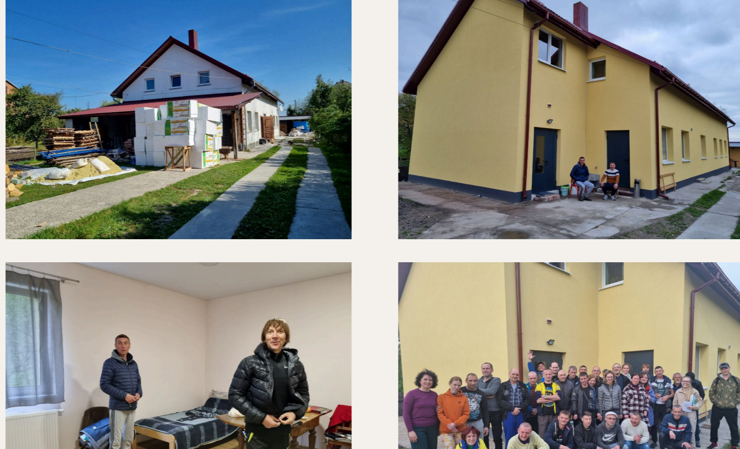
Foto 1- taller de muebles antes de la renovación. Fotos 2, 3, 4- taller de muebles después de la renovación.

En Ucrania, el grupo de Oselya mejora las condiciones de vida de las compañeras y compañeros.