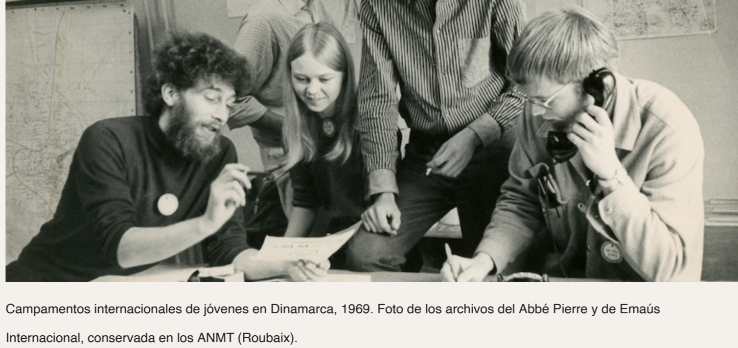
Campamentos internacionales de jóvenes en Dinamarca, 1969.

Los campamentos de verano son una parte esencial del Movimiento Emaús desde los años 60. Estos encuentros le han dado forma al movimiento hasta ser lo que conocemos hoy y han sido el punto de partida de numerosas «vocaciones» en el seno de Emaús. Repasamos el funcionamiento de estos momentos de convivencia y solidaridad.