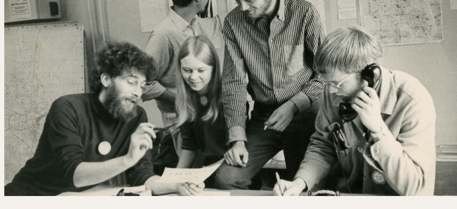
Camps internationaux de jeunes au Danemark, 1969.

Les chantiers d'été sont au cœur du Mouvement Emmaüs depuis les années 60. Ces rencontres ont façonné le mouvement tel qu'il est aujourd'hui, et ont été le point de départ de nombreuses « vocations » au sein d'Emmaüs. Retour sur le fonctionnement de ces moments conviviaux et de solidarité.