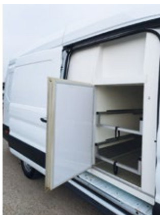
Una furgoneta frigorífica completamente nueva y una cocina comunitaria, que cumple las normas, para Emaús Iasi, que podrá seguir con las rondas en buenas condiciones.