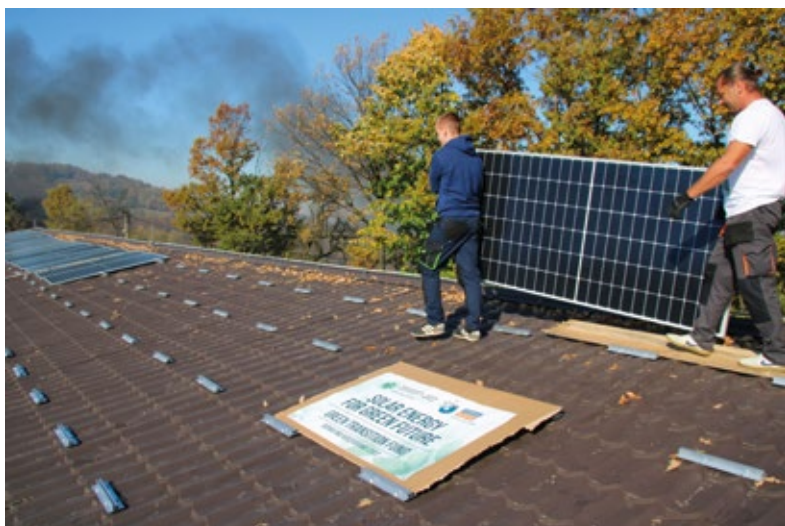
Proyecto del FIS-Emaús apoyado en 2022.

construcción: renovación de los edificios de los grupos, inversiones en energías renovables... Esto excluye aquellos gastos cuyo impacto es menos sostenible (coche eléctrico, punto de carga...). Si deseáis implicaros en un proyecto significativo, ¡no dudéis en contactar con Emmanuel!