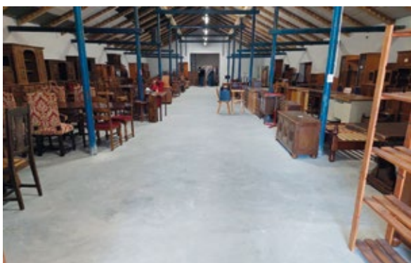
Una nueva sala y un bellissimo tejado rosa, que cumplen las normas contra incendios para el depósito de Emaús Satu Mare, en Rumanía.