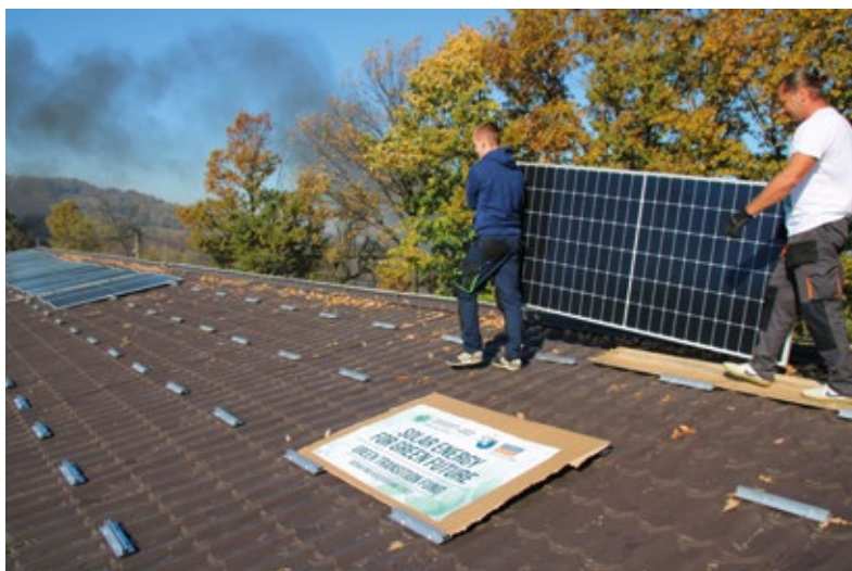
Projet du Fis-Emmaüs soutenu en 2022.