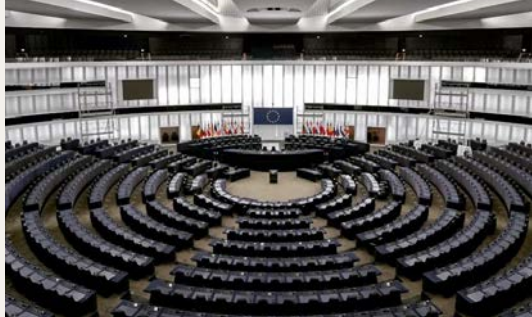
Légende : Vue aérienne de la chambre parlementaire du Parlement Européen

Emmaüs Europe s'est associée à plus de 250 associations, entreprises et chercheur·ses européen·nes pour écrire aux États européens et tenter de sauver les acquis du "Pacte vert pour l'Europe" dans cette période de trilogue où les États, la Commission et le Parlement vont prendre la décision finale sur la directive Omnibus. Lire notre interpellation.