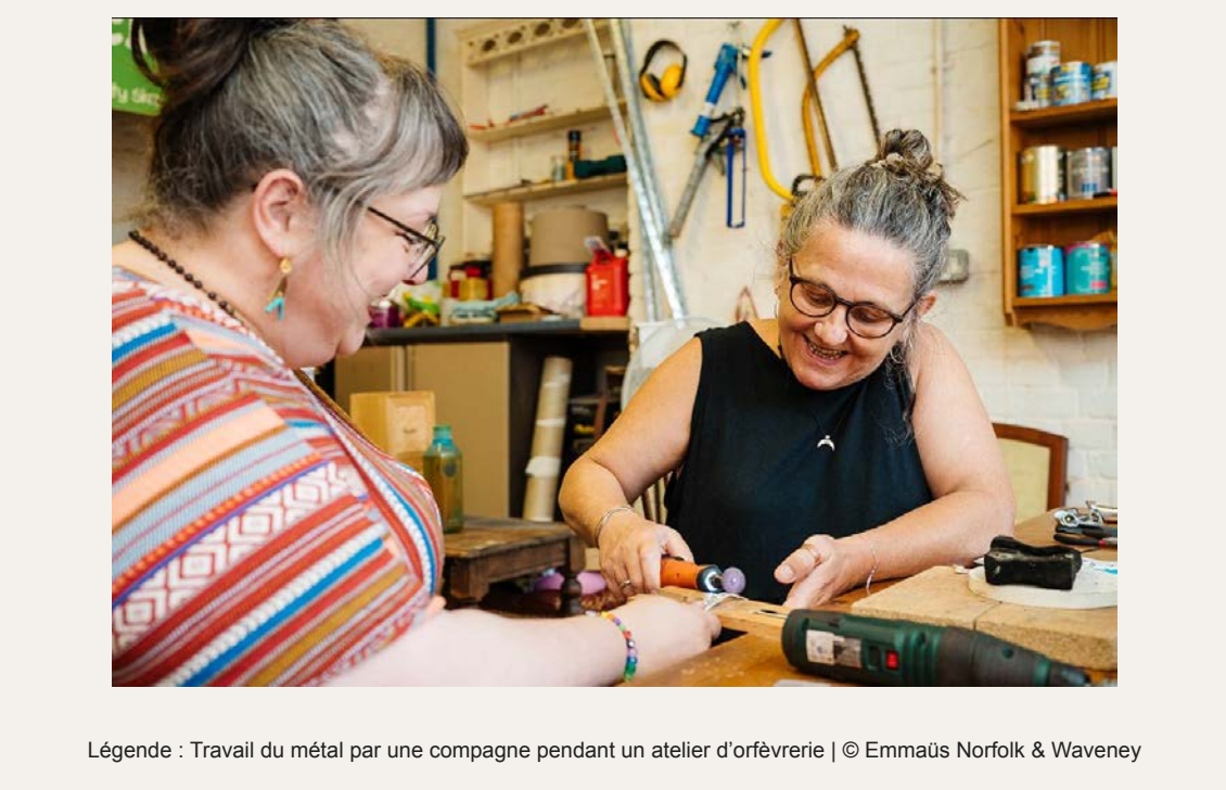
Légende : Travail du métal par une compagne pendant un atelier d'artisanat