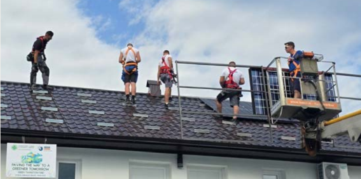
Légende : À Srebrenica, des panneaux solaires sont installés pour améliorer le quotidien des enfants accueillis

Pour rappel, les groupes Emmaüs peuvent soutenir le Fonds de Transition Écologique, qui permet de financer les projets d'impact énergétique pour les groupes Emmaüs d'Europe de l'Est.