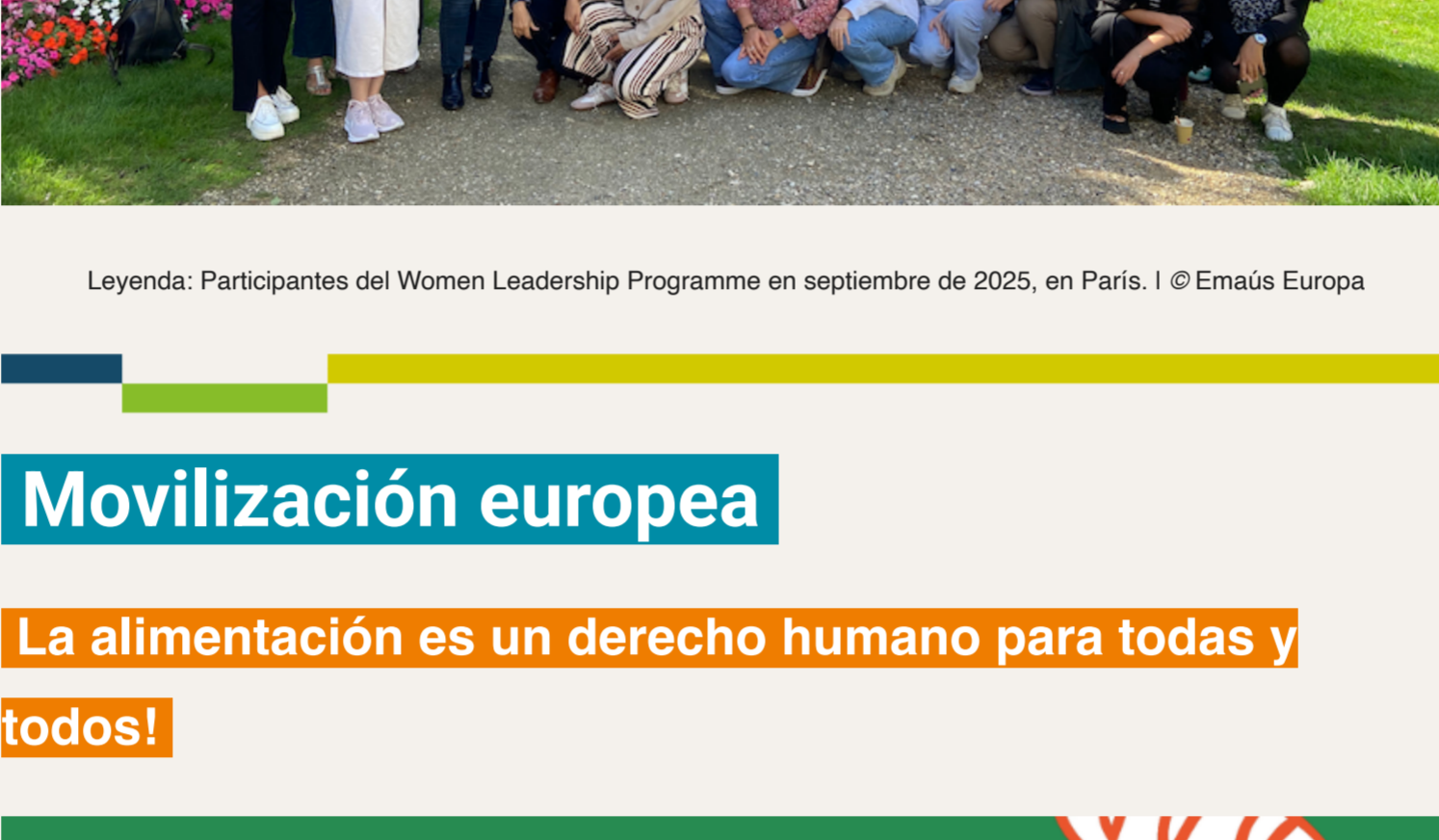
Leyenda: Participantes del Women Leadership Programme en septiembre de 2025, en París.