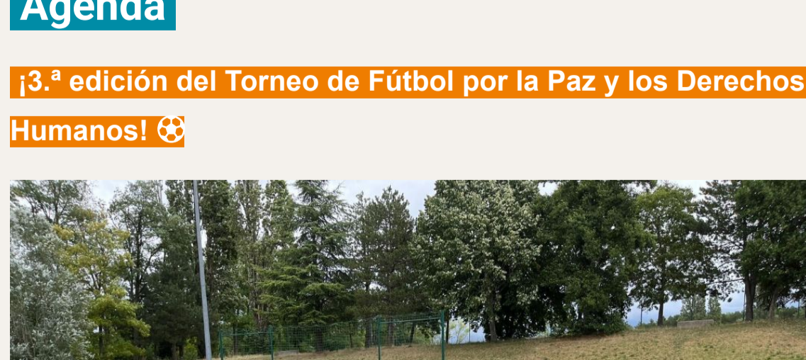
Los y las participantes en la segunda edición del Torneo, en Dijon (Francia)

Mientras la FIFA organiza su Copa del Mundo 2026 al otro lado del Atlántico, ¡Emaús Europa organiza la suya! ¡Y tiene mucho más que ofrecer que un simple trofeo! ¡Nos vemos en Srebrenica (Bosnia-Herzegovina) del 5 al 8 de julio de 2026 para celebrar la 3.ª edición del Torneo de fútbol de Emaús Europa por la Paz y los Derechos Humanos!